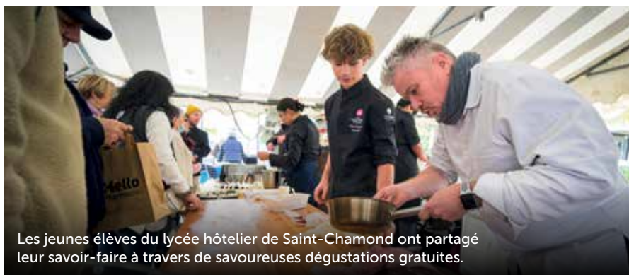
Les jeunes élèves du lycée hôtelier de Saint-Chamond ont partagé leur savoir-faire à travers de savoureuses dégustations gratuites.

Le 18 octobre, l'Espace Notre-Dame a accueilli 2 000 visiteurs pour la 3 e édition du Salon Demain Autrement. Ambiance conviviale dans les allées, avec 70 exposants et une trentaine d'animations ! La journée a culminé avec la remise des Trophées RSO scolaires, valorisant les projets les plus originaux : Prix du Public pour Sainte-Marie La Grand'Grange, Prix du Jury pour Ennemond Richard, Pierre Joannon et la MFR. Les visiteurs ont