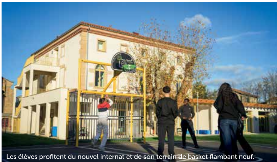
Les élèves profitent du nouvel internat et de son terrain de basket flambant neuf.

nouvel internat moderne et un lien étroit avec les familles, l'accompagnement renforcé fait toute la différence. Shainez témoigne : "Moi, je n'aimais pas l'école,