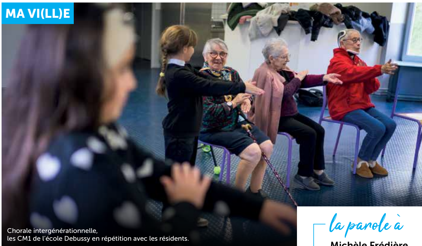
Chorale intergénérationnelle, les CM1 de l'école Debussy en répétition avec les résidents.